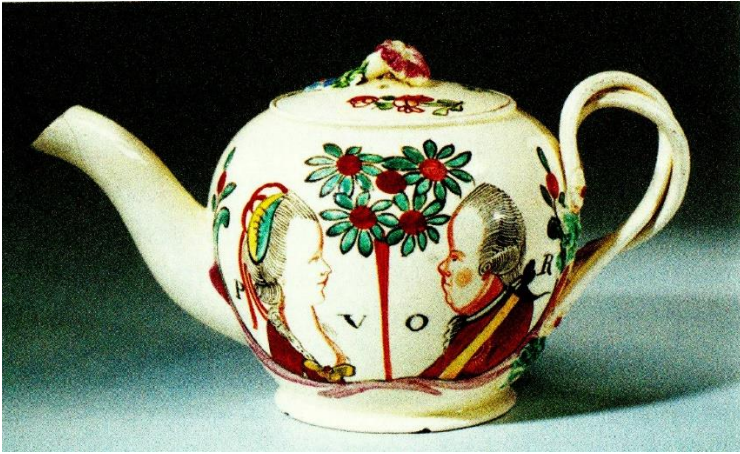
Afb. 3 Er werd deftig en politiek verantwoord thee gedronken, door de prinsgezinden uit een Wedgwood pot met een Oranjeboom en het stadhouderlijk echtpaar gesierd.