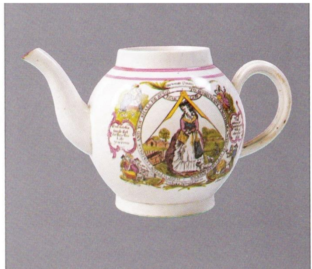
Afb. 4 Vrijmetselaren kregen uit Frankrijk hún theepot gesierd met passer en winkelhaak.